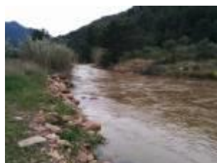
La rambla en l'engolidor dels terrers de Sant Joan