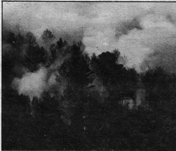
La sierra de l'Espadà sufre numerosas agresiones ecológicas