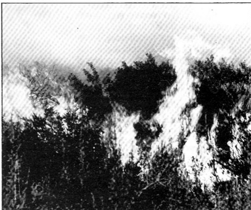
Als darrers vint anys s'han produït al voltant de 300 incendis que han suposat la crema de 20.000 hectàrees.

— Suport a les normatives urbanístiques que alguns pobles