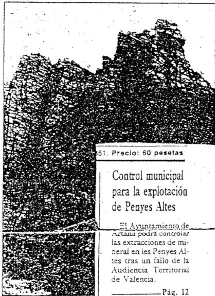
St. Precio: 60 pesetas