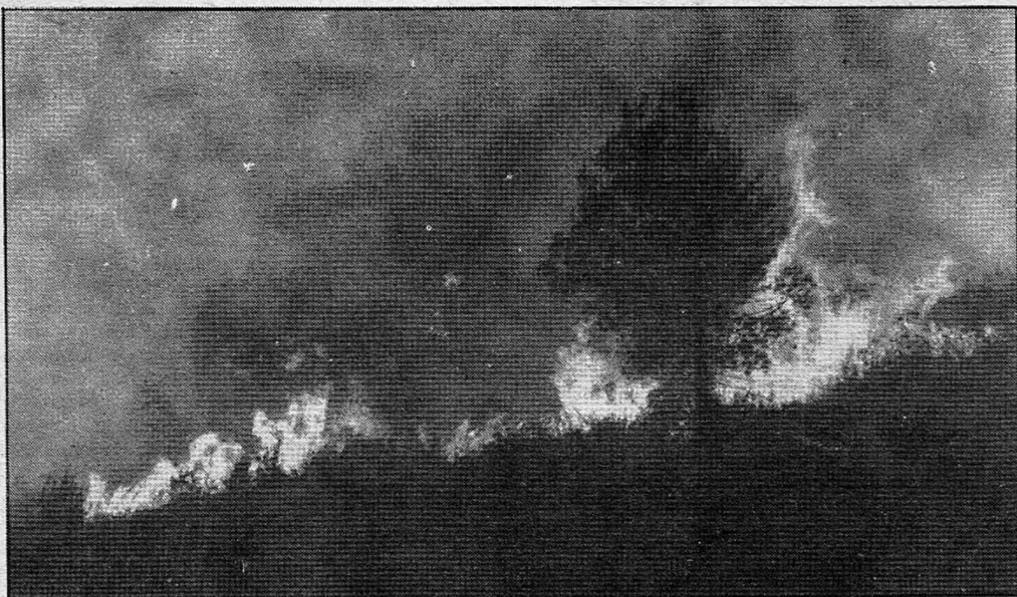
Varios municipios, afectados por el imparable fuego

Afecta a la zona de Clontà - Penyes Altes entre otros llocs. Crediterinesc 11-7-85