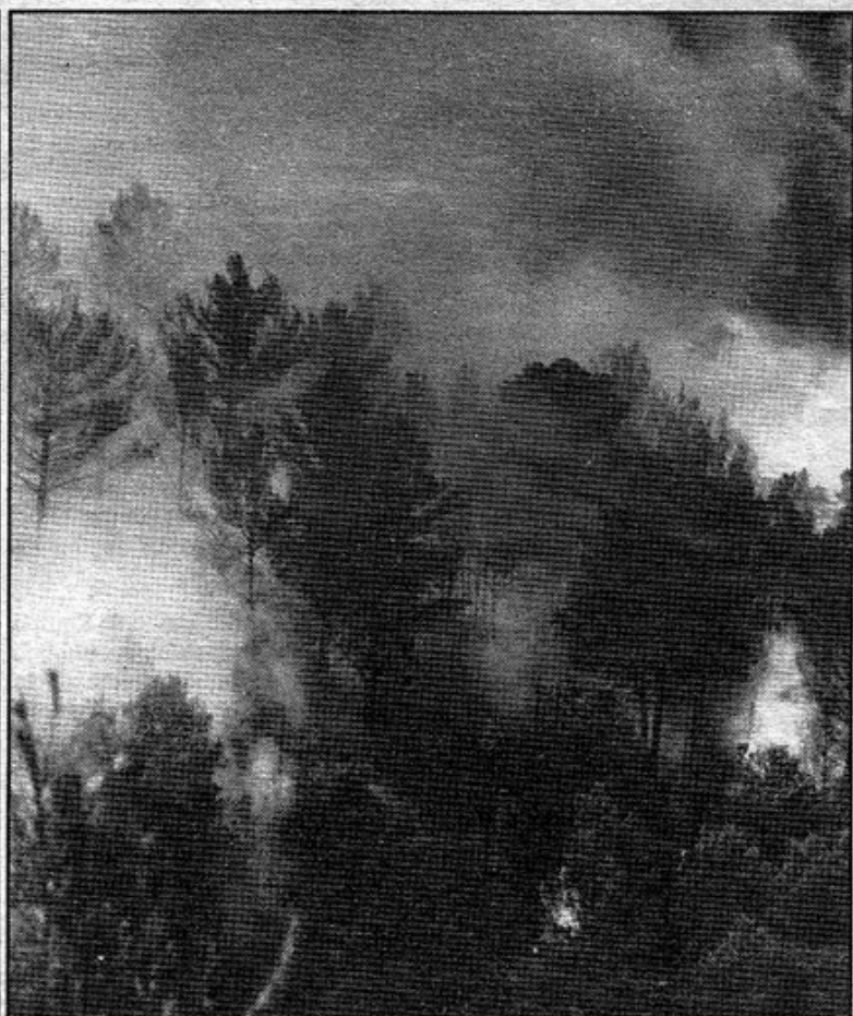
Los hidroaviones también participan en las tareas de extinción

El frente, a pocos kilómetros de la población de Onda